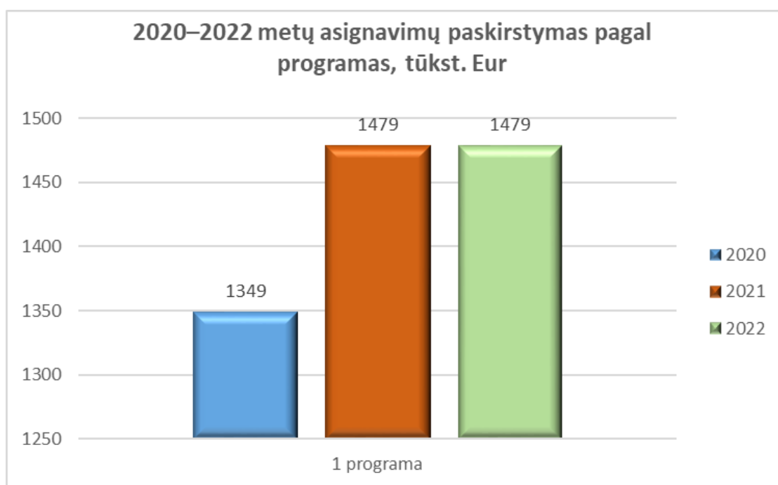
2 grafikas. 2020–2022-ųjų metų asignavimų pasiskirstymas pagal programas (tūkst. Eur.)

Strateginis Lietuvių kalbos instituto tikslas – plėtoti lietuvių kalbos mokslinius tyrimus ir užtikrinti jų sklaidą.